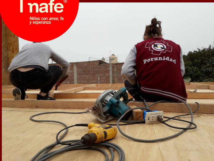
Bénévole de Pérunidad sur le chantier de construction du centre NAFE