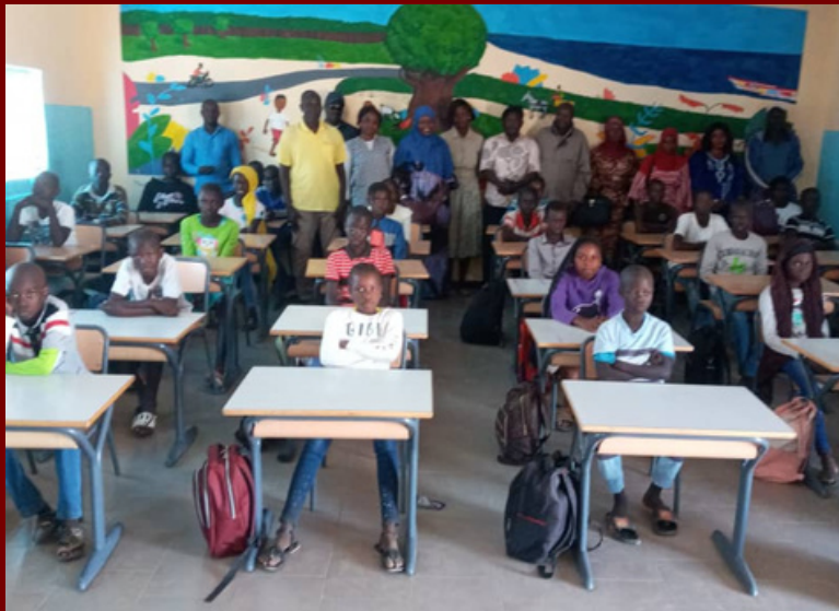
Intérieur de la salle construite au Sénégal

A cause de la situation politique au Burkina Faso, nous ne pouvons plus aller dans le pays et sommes contraints d'aider le centre depuis la France. C'est pourquoi l'équipe d'Africa Unite se rend désormais au village de Mbam au Sénégal, en 2023 nous avons notamment construit une salle de classe et des sanitaires pour le collège. A terme nous avons pour objectif d'y construire, avec la population, un centre semblable à celui du Burkina Faso.