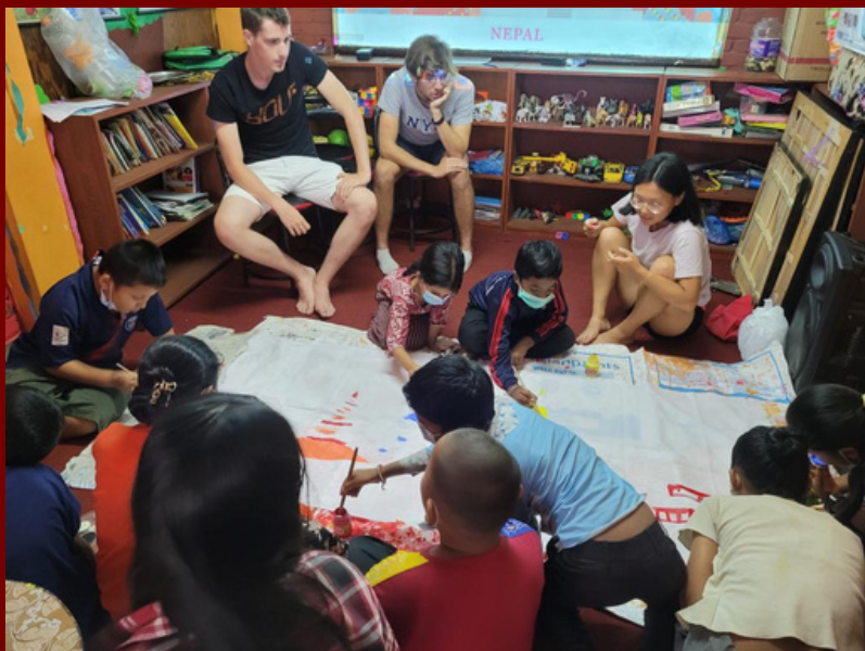
Création d'une fresque destinée à des enfants d'une école en France.

Nous finançons donc entièrement ce centre éducatif, comprenant le salaire des professeurs, le loyer, l'électricité, le matériel scolaire... Entre juin et juillet, notre équipe de 12 bénévoles se rend sur place pendant 6 semaines pour donner des cours aux enfants, au niveau des devoirs ou de la compréhension des cours, et aider UDMF dans les rénovations du centre (repeindre les salles de classes, reconstruire des infrastructures...).