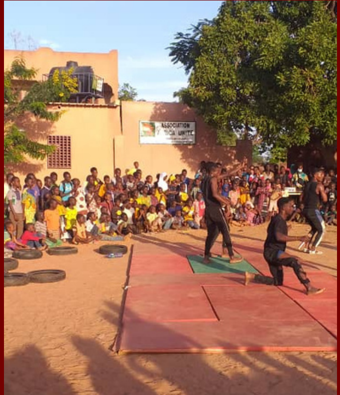
Festival des arts du cirque 2023 au centre burkinabé

Développement d'un centre éducatif au Burkina Faso pour les enfants d'un quartier défavorisé de Bobo Dioulasso. Afin de faciliter l'accès à l'éducation des enfants, des ressources numériques et papiers sont disponibles, des cours de soutien scolaire y sont donnés, des films de sensibilisation diffusés, des actions culturelles réalisées. Fin 2022 nous avons financé la construction et l'entretien d'une médiathèque.