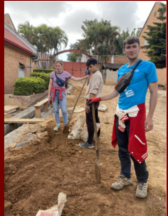
Construction d'un canal d'assainissement

Nous oeuvrons pour la réinsertion d'enfants des rues à travers des projets de réhabilitation et d'amélioration des infrastructures des villages d'enfants, appartenant aux Enfants du Soleil, de Antsirabe, Antananarivo, Tamatave et Fianarantsoa. Nos projets sont faits par et pour les malgaches et visent à apporter une aide à la fois immédiate et durable. Ainsi, nous rénovons et agrandissons des écoles et installons des latrines et de plusieurs canaux d'assainissement afin d'y améliorer les conditions d'hygiène.