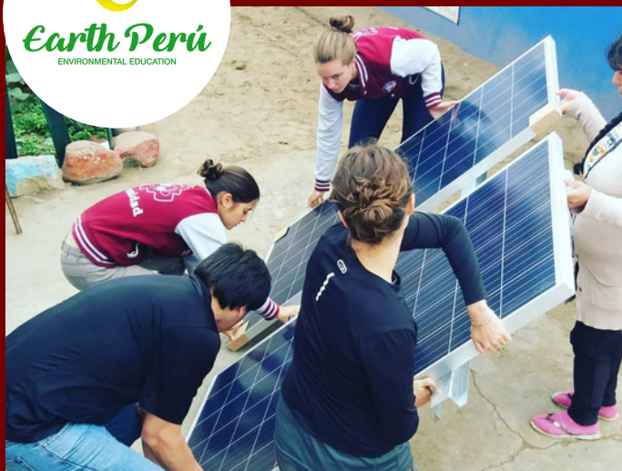
Bénévoles de Pérunidad à Trujillo réalisant une pose de Panneaux solaires

En partenariat avec l'ONG NAFE, Notre Section Pérunidad participe activement au développement d'un centre éducatif à Huanchaco. Ce soutien se fait au travers d'une participation à la construction et à la rénovation du centre, ainsi qu'au soutien scolaire apportés aux enfants des milieux défavorisés.