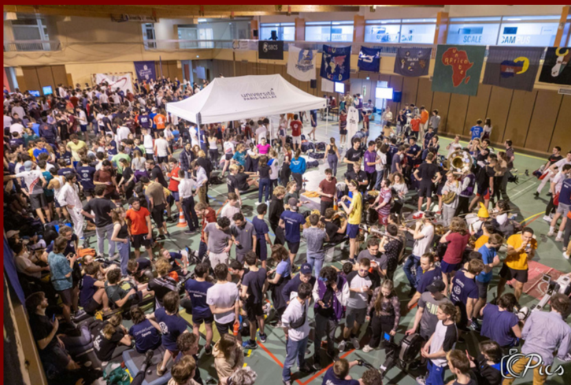
Humaviron le 30 avril 2023