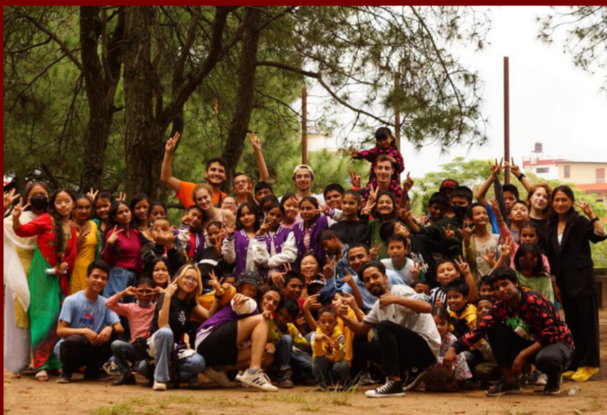
Photo de notre section avec les enfants du centre l'année dernière.

Népal Āśā est une association de CentraleSupélec dont l'objectif est de faire vivre le centre éducatif de l'association UDMF-Nepal à Katmandou, en accueillant 110 enfants en situation de précarité. Le Népal est encore dépendant de l'aide humanitaire suite au séisme de 2015, et les enfants sont les premières victimes des insuffisances des institutions. L'association prend en charge les plus menacés par la déscolarisation et leur ouvre ses portes le matin avant les cours et le soir après ceux-ci.