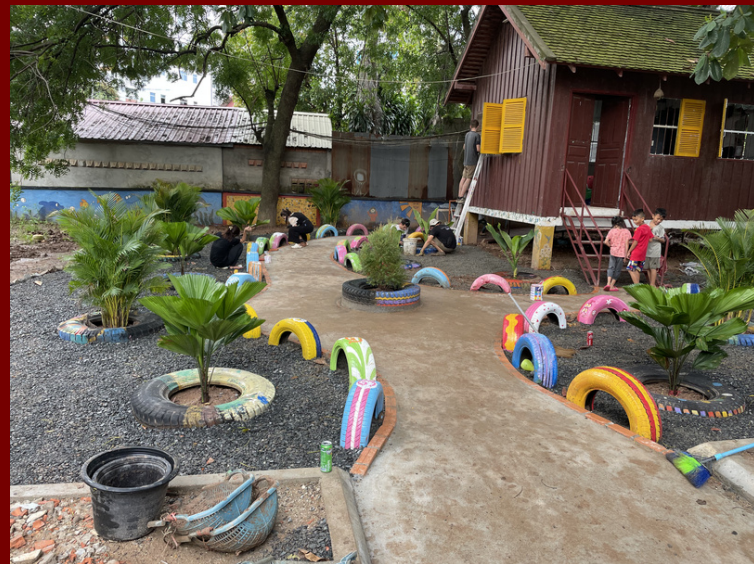
Rénovation de la zone autour de la "Art Therapy House", une maison du centre dédiée au développement de la créativité des enfant

Depuis sa création en 2014, nous nous rendons au Center for Child and Adolescent Mental Healthcare (CCAMH) de Phnom Penh. Les CCAMH sont les uniques centres d'aide aux enfants souffrant de maladies mentales au Cambodge. Ils mettent au cœur de leurs priorités le développement social et intellectuel de l'enfant handicapé. Ainsi, chaque année nous continuons d'aménager le centre afin d'améliorer la qualité de vie des enfants tout en le rendant plus inclusif pour permettre aux personnes en fauteuil roulant d'y circuler.