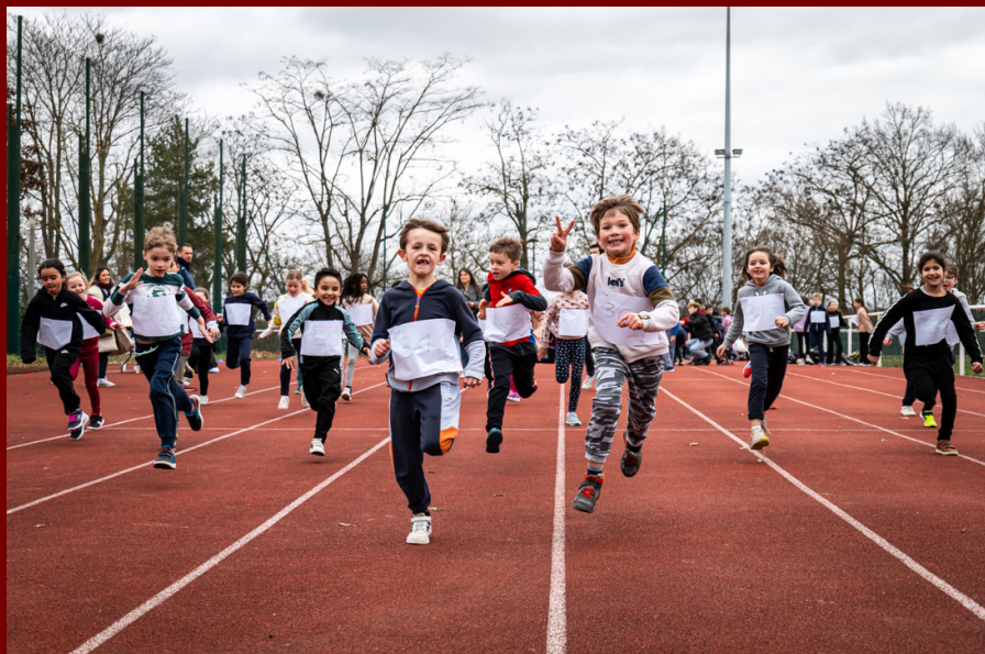
Course de solidarité à l'école primaire Les Condamines à Versailles le 2 février 2023