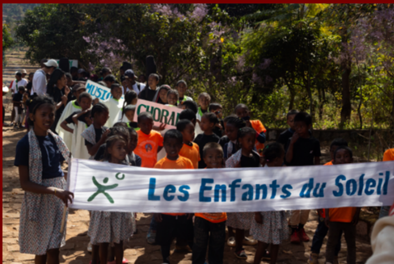
Sortie avec les enfants à Andranobe à l'occasion d'un festival d'activités et d'art

Nous achetons également du matériel nécessaire au bon fonctionnement des écoles. Enfin, il nous tient tout particulièrement à cœur d'égayer le quotidien des enfants en leur offrant l'opportunité de sortir de leur village et de partir pour quelques jours en vacances.