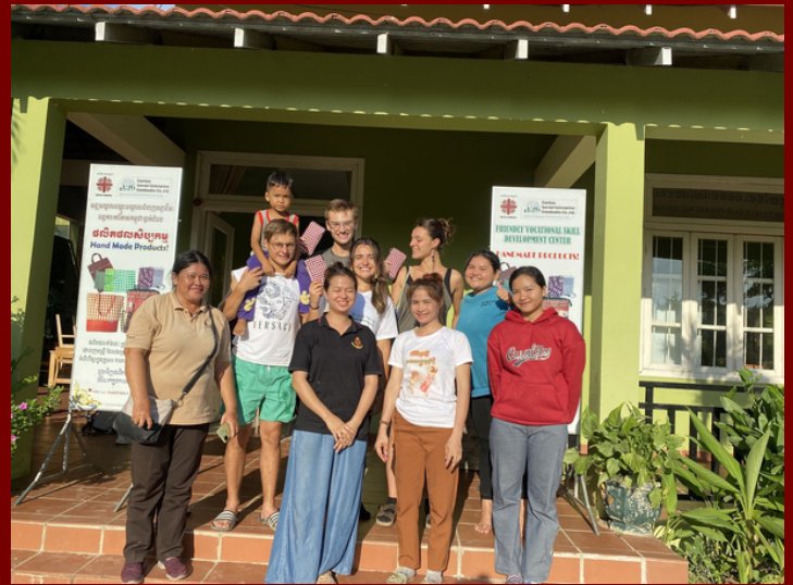
Friendly Vocational Development Center for Young Women and Young Mother with Children (FVSD)

Notre objectif est d'assister les populations khmères dans le développement du Cambodge, en les aidant à acquérir une autonomie alimentaire et à améliorer les conditions d'hygiène dans les villages reculés où nous nous rendons. Ainsi, nous y construisons des infrastructures agricoles et sanitaires tels que des systèmes d'irrigations et serres pour les cultures, des latrines et points de raccordement à l'eau, et aidons également les familles les plus démunies dans la rénovation ou dans la construction d'habitations. De plus, nous soutenons aussi bien financièrement que matériellement un centre aidant les femmes victimes du trafic humain à se réinsérer dans la société à travers des formations professionnelles et un suivi médical (FVSD).